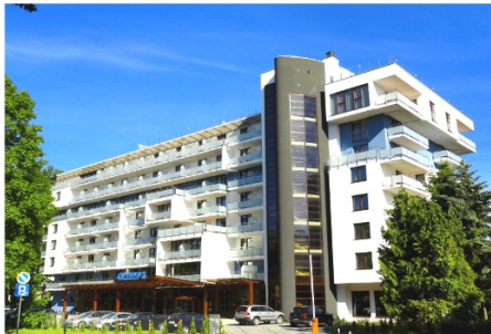
Hotel Olymp 3

Kolberg, polnisch Kolobrzeg, ist die älteste aller hinterpommerschen Städte. In Anlehnung an den Namen Kolbergs als Sole-, Moor- und Seebad kann man von den drei großen Vorteilen Kolbergs für die Gesundheit seiner Besucher sprechen. Kolberg ist ein Heilbad mit natürlichen Solequellen und mit medizinisch wirksamen Mooren. Es hat einen sechs Kilometer langen, breiten, feinsandigen Strand, welcher seit vielen Jahren tausende Besucher an die Küste lockt. Kolberg verzeichnet im Durchschnitt ca. 1800 Stunden Sonnenschein jährlich, gut für Sie und für Ihre Gesundheit. Ein vielfältiges Kunst- und Kulturangebot sorgt für einen anspruchsvollen Rahmen. Für Abwechslung sorgt der städtische Charakter mit vielen gastronomischen Kleinoden hinter versteckter Kulisse. Lassen Sie sich überraschen von einer Stadt mit speziellem Charme.