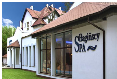
Hotel Baginścy Spa

Poberow, polnisch Pobierowo, ist ein kleiner Ferienort eingebettet in einen schönen Kiefernwaldbestand. Der Ort hat einensönen breiten Sandstrand und liegt an der Rewaler Küste, etwa 50 km westlich von Kolberg. Der Ort lädt mit seinen zahlreichen Geschäften, Cafés und Restaurants, von denen einige leider nur in der Hochsaison geöffnet sind, zum Flanieren ein. Im Hochsommer (Juli und August) sind viele Tagesurlauber im Ort, so dass es dann etwas lebendiger zugeht.