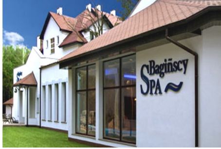
Hotel Baginscy Spa

Poberow, polnisch Pobierowo, ist ein kleiner Ferienort eingebettet in einen schönen Kiefernwaldbestand. Der Ort hat einensönen breiten Sandstrand und liegt an der Rewaler Küste, etwa 50 km westlich von Kolberg. Der Ort lädt mit seinen zahlreichen Geschäften, Cafés und Restaurants, von denen einige leider nur in der Hochsaison geöffnet sind, zum Flanieren ein. Im Hochsommer (Juli und August) sind viele Tagesurlauber im Ort, so dass es dann etwas lebendiger zugeht.