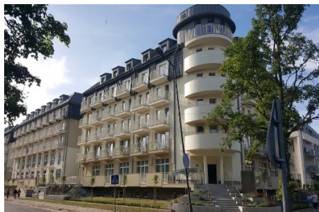
Hotel Drei Inseln

Swinemünde, polnisch Swinoujście, ist einer der bekanntesten Ferien- und Badeorte an der polnischen Ostseeküste. Der Ort erstreckt sich über mehrere Inseln, die bekanntesten sind Usedom, Wollin und Kaseburg. Der Ort wird im Süden und Osten vom Stettiner Haff begrenzt. Im Norden grenzt der Ort an die Ostsee. Zwischen Usedom und Wollin verkehrt eine Autofähre. Klimatisch gesehen hat Swinemünde überdurchschnittlich viele Sonnenstunden. Das Meerwasser ist eines der wärmsten Polens. Der Ort ist Handels- und Hafenstadt und hat ca. 45.000 Einwohner. Die deutschen „Kaiserbäder“ sind per Schiff, Bus, Fahrrad oder zu Fuß bequem erreichbar.