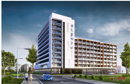
Hotel Olymp IV

Kolberg, polnisch Kolobrzeg, ist die älteste aller hinterpommerschen Städte. In Anlehnung an den Namen Kolbergs als Sole-, Moor- und Seebad kann man von den drei großen Vorteilen Kolbergs für die Gesundheit seiner Besucher sprechen. Kolberg ist ein Heilbad mit natürlichen Solequellen und mit medizinisch wirksamen Mooren. Es hat einen sechs Kilometer langen, breiten, feinsandigen Strand, welcher seit vielen Jahren tausende Besucher an die Küste lockt. Kolberg verzeichnet im Durchschnitt ca. 1800 Stunden Sonnenschein jährlich, gut für Sie und für Ihre Gesundheit. Ein vielfältiges Kunst- und Kulturangebot sorgt für einen anspruchsvollen Rahmen. Für Abwechslung sorgt der städtische Charakter mit vielen gastronomischen Kleinodien hinter versteckter Kulisse. Lassen Sie sich überraschen von einer Stadt mit speziellem Charme.